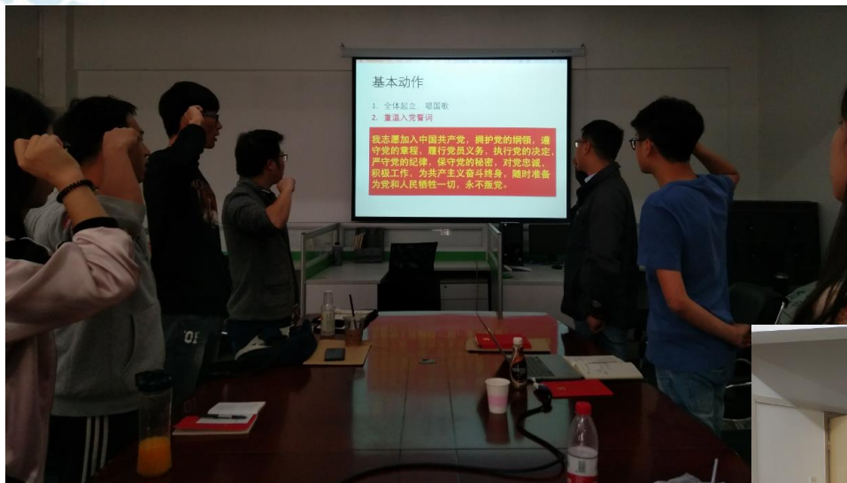
主题党日-进行基本动作