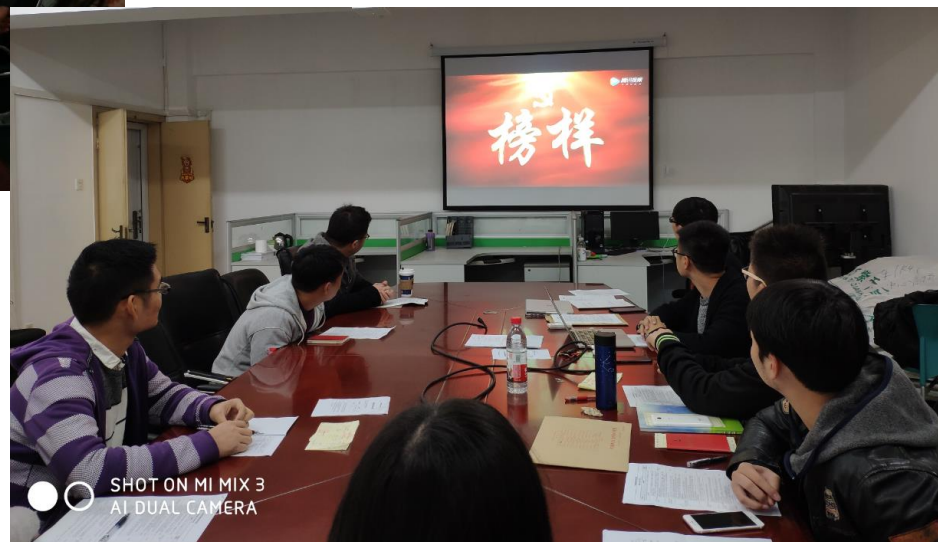
党组织生活会-集体观看、学习《榜样3》